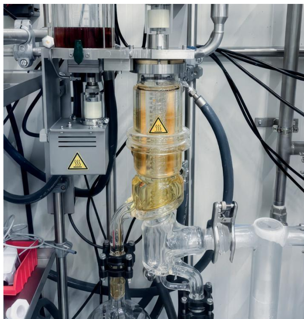
由UIC公司为罗伯特集团生产制造的短程蒸馏装置

如今，无色、精制 / 浓缩型提取物的需求与推广，已成为高端香精香料行业的核心基石。这类原料不仅能保证产品外观均匀一致，还能为消费者带来独特的感官体验。消费者通常将清澈、浓缩视为纯度、工艺水准与高端品质的重要标志。